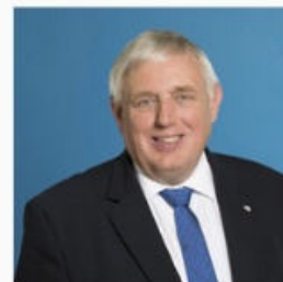
KARL-JOSEF LAUMANN MINISTER FÜR ARBEIT, GESUNDHEIT UND SOZIALES DES LANDES NRW